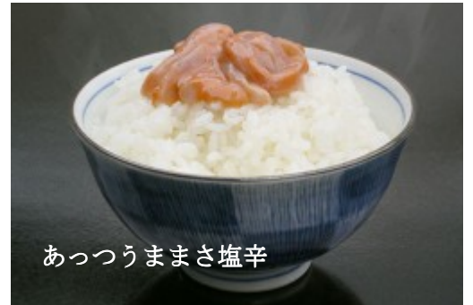
あつつうままさ塩辛

表示を見ると110gという小さなビンに17gくらいの塩が入っていました。そういえば小さい時に塩引きといってご飯の上に、思いっきり塩辛い鮭の身をほぐして水をかけてお茶漬けのようにして食べた記憶があります。