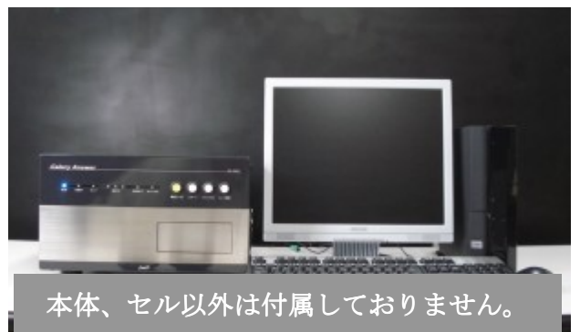
本体、セル以外は付属していません。

新機種(CA-HM)の営業で商談に行った先のオーナーとの会話でとても感動したお話がありました。まだ納品前ですので公表は差し控えたいと思いますがお酒の小売店に納品します。煙草は百害あって一利なしと云われて久しいですがお酒は嗜みかたによっては百薬の長ともいいますね。(愛煙家からみたら愛飲家に都合のいい理屈かもしれませんが)そういったことをアピールしていくのではないかと考えています。