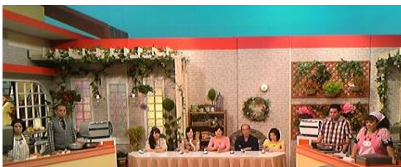
▲TBS「となりのマエストロ」に出演。低カロリー食品を測定しました！

これからも皆さんの茶の間で「カロリーアンサー」をご覧いただく事があると思います。