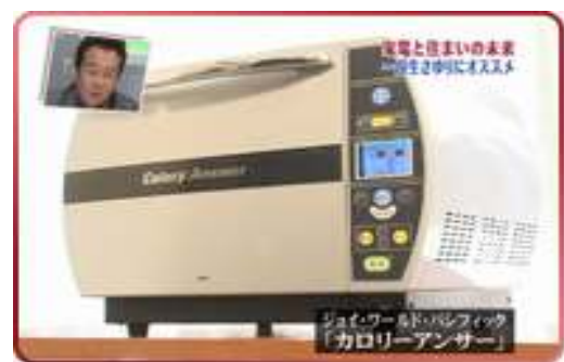
▲日本テレビ「未来からの訪問者」に出演