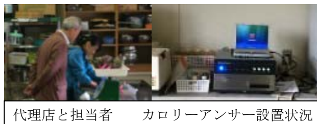
代理店と担当者 カロリーアンサー設置状況

3月のメンテでナンスは、代理店様へ同行して頂きまして奈良県のお客様へ訪問しました、地物の食産業への貢献の為に試行錯誤しているようです。観光地が多い地域でしたが、残念ながら何処へも行けませんでした。今回は、斑鳩（いかるが）の里を満喫したいところです。今回のラ～メンリポートは、事前に訪問先の近所を代理店様が検索して下さいまして、一緒にご馳走になりました。ラ～メン屋さんが5km圏内に20店舗もあり、私にとっては夢の様な町ですね。肝心のラ～メンは、かなりお上品な塩味で塩のブレンドに手間をかけた一品でした。今月は、しょっぱめが多かったので、ほのかな鶏ガラ出汁がたまらなかつたです。奈良県へ御用の際は「あす香」を訪れてみて下さい。