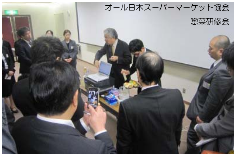
オール日本スーパーマーケット協会 惣菜研修会

は見えませんが「生きている証も輝く未来」も遠くに見えませんが生暖かで眩しい陽気を感じる事だけは出来ました。こんな感じで事務所にいる事は珍しく、相変わらず東奔西走の日々を過ごしております。月初めには長野の練りサラダ専門メーカー様にデモ機を一週間貸出して評価を頂きました。8日～9日にはAJS（オール日本スーパーマーケット協会）の惣菜研修会が甲府で開催され、食品表示法の施行スケジュールと絡めてカロリーアンサーの活用事例発表をコラニー文化ホールで行いました。会員企業の惣菜関係者45名の前で流行のデータベース計算などと公平？に比較し、客観的な実測値の有意性について熱弁？をふるったつもりです。10日には東京都町田市の保健所で管内の飲食店から持ち込まれた食事メニューの栄養測定を行ないました。昨年が続いてのイベントですが個人オーナーの関心が高まっている事を実感いたしました。22日には島根県出雲へ納品です、翌23日は広島と呉で商談です。もちろん、この間に水生哺乳類の研究を行っている事業所や総合菓子メーカーとの納入契約も結んでおります。さらにとんかつメーカーや老舗の総合レストランメーカーとの契約交渉もヤマ場です。そう云えば例年の今頃は花粉の猛威にぐったりの日々なのですが工ヘン、今年は克服できるまでは言い切れませんがワセリンなるもののお陰でかなり症状が緩和されました。鼻と目の周りはベトベトですが！詳しく聞きたい方や積もる話があればぜひ日本橋へおいで下さい。めーコーヒーでも飲みながら花粉対策と傾向について話し合しましょう。